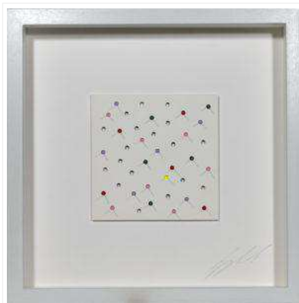
David Speybrouck 'For You'

Een ander recent werk dat qua poëtische zeggingskracht niet moet onderdoen voor Butterflies, is For You (2018), dat 43 cm bij 43 cm als afmetingen heeft. Een wit vierkant karton kleeft op een witte ondergrond. Op min of meer gelijke afstanden doorboorde Speybrouck het karton, zodat er gaatjes van gelijke grootte ontstonden. Onder sommige van die gaatjes kleefde hij papier in diverse kleuren. Precies in het midden van de gekleurde cirkels prikte hij een speld, opnieuw met de punt naar de beschouwer toe. Opvallend is dat hij dat niet deed met de gaatjes waaronder hij geen papier kleefde. Elk van de spelden werpt onder invloed van het licht een dubbele slagschaduw af in verschillende grijswaarden. Het resultaat is niet minder dan betoverend. Met dit werk legde Speybrouck andermaal een geslaagde proeve van driedimensionale poëzie af.